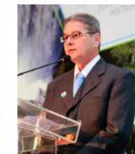
Palestrante Hideraldo Buch Presidente Nacional do Fórum de Comitês de Bacias Hidrográficas