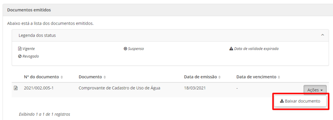
Figura 11 - Ação "Baixar documento" da verificação de documentos emitidos.