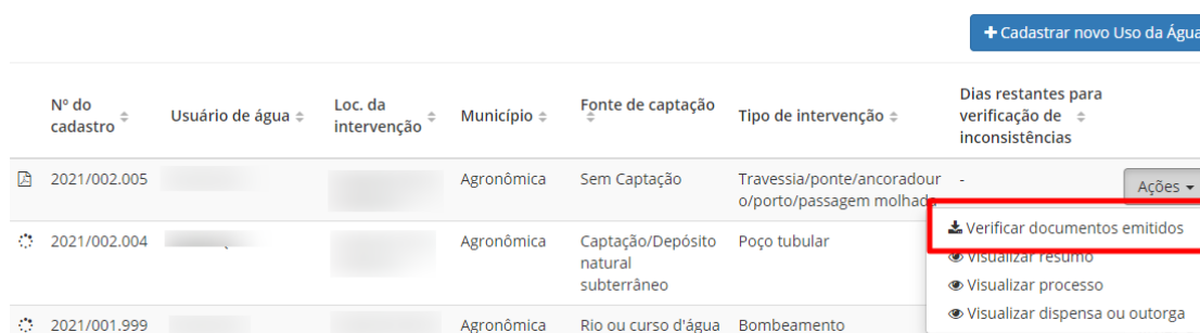
Figura 10 - Ação "Verificar documentos emitidos".

O documento estará disponível para download também por meio do botão “Ações” e “Visualizar documentos emitidos”. Ao entrar na página de documentos emitidos, basta encontrar o documento desejado, clicar em “Ações” e em “Baixar documento”.