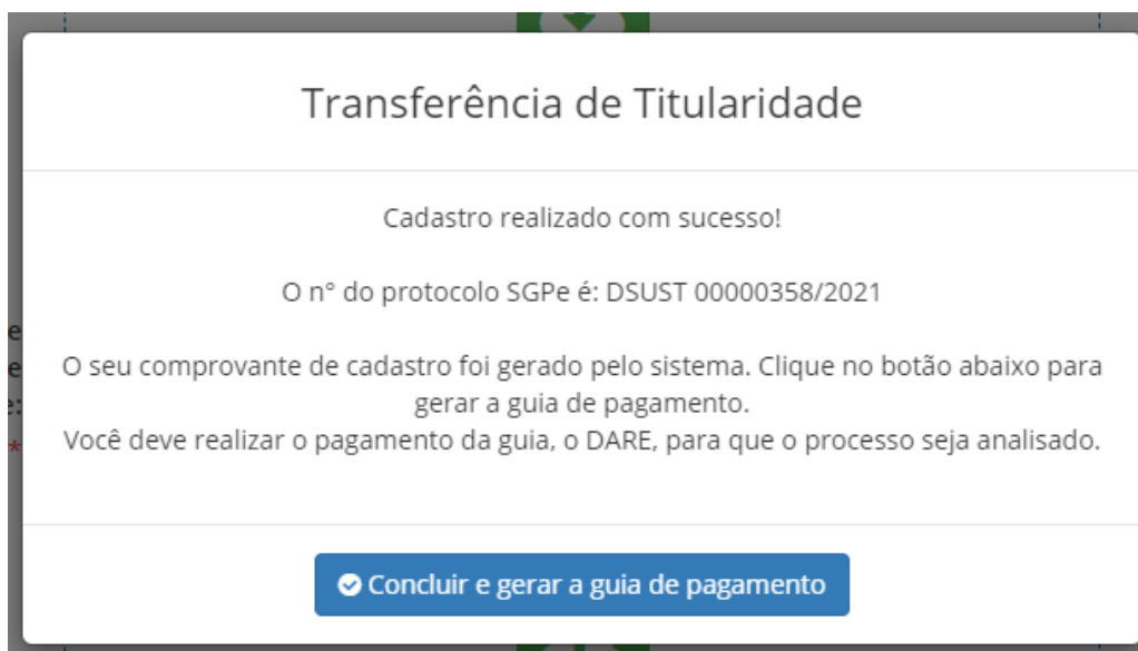
Figura 6 - Tela de confirmação da finalização do cadastro.

Enquanto o processo aguarda pagamento, o usuário poderá acessar o resumo da transferência solicitada, ter acesso ao comprovante de solicitação de transferência e baixar novamente o DARE que foi gerado por meio do botão “Ações”.