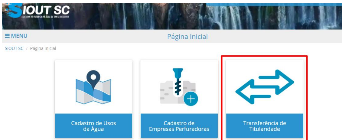
Figura 2 - Módulo "Transferência de titularidade".

Com isso, o sistema abrirá uma página contendo uma lista com os processos de transferência já cadastrados pelo usuário. Ao clicar em "Cadastrar Transferência de Titularidade", um formulário para a inserção das informações será aberto.