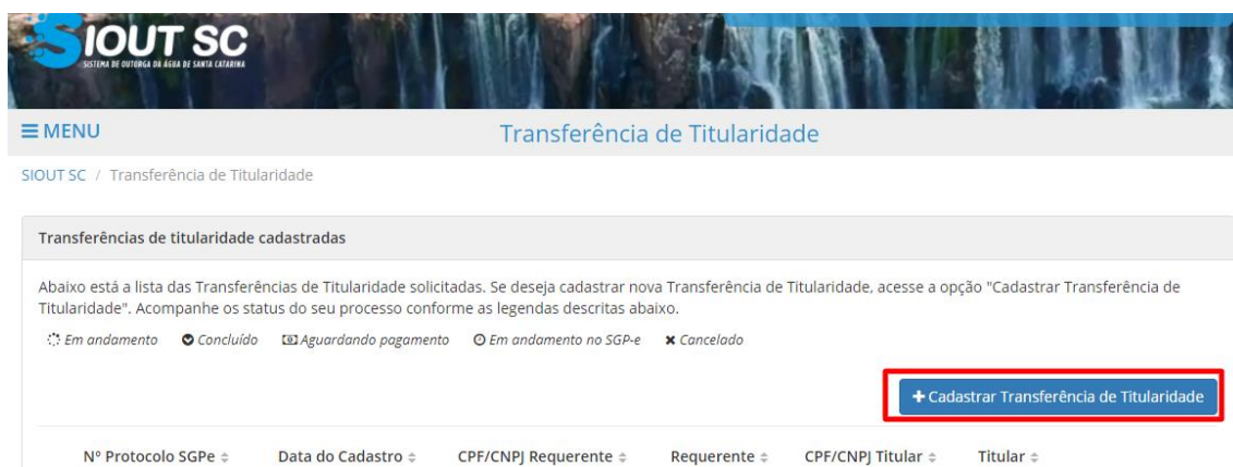
Figura 3 - Tela em destaque com o botão "Cadastrar transferência de titularidade".

Com isso, o sistema abrirá uma página contendo uma lista com os processos de transferência já cadastrados pelo usuário. Ao clicar em "Cadastrar Transferência de Titularidade", um formulário para a inserção das informações será aberto.